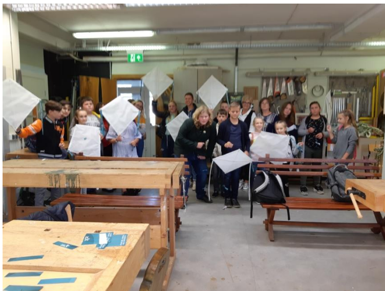
Aitvarai tikrai skrenda