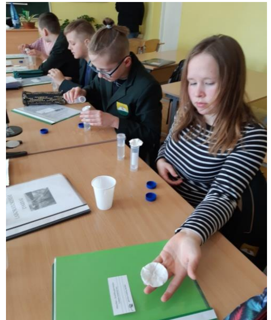
Filtravimas ir jo reikšmė