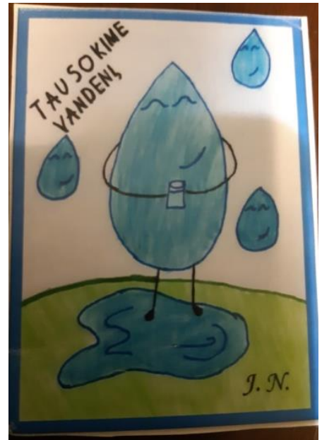
Justo Naviko kūrybinis darbas – emblema