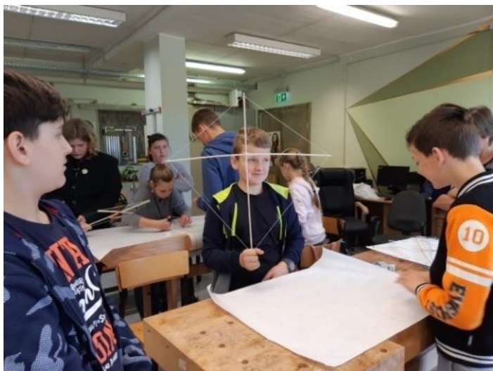
Kauno kolegija . Bionika ir technologijos.