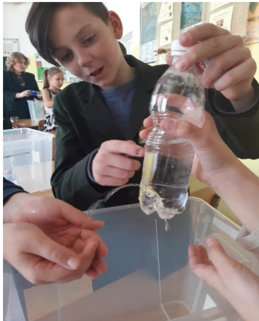
Vandens savybės ir slėgis induose