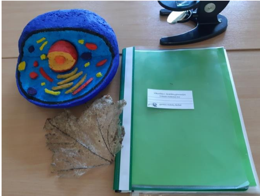
Justo Karselio Gyvūno ląstelės modelis