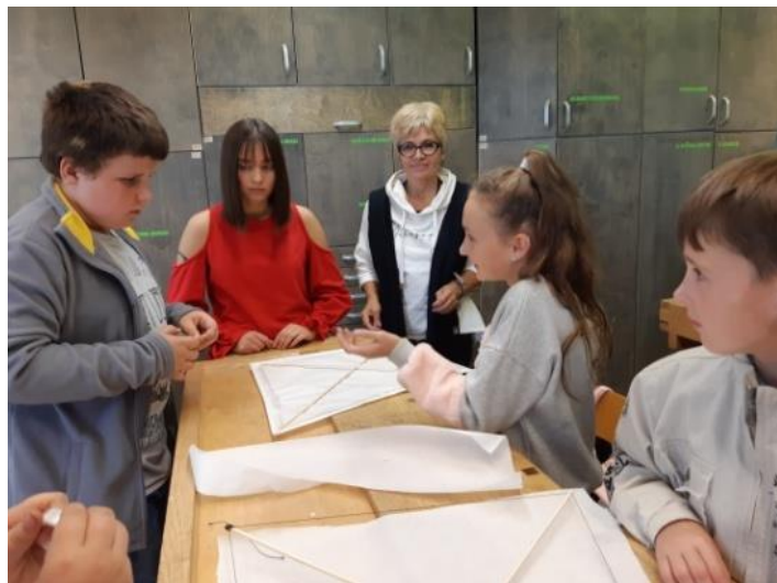
Kaip išmokti skristi? Aitvarų gaminimas